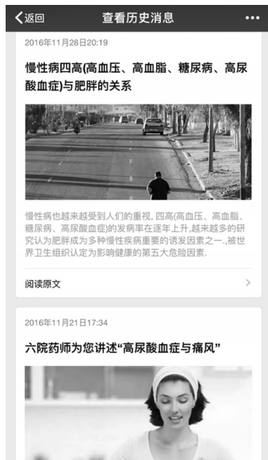
图2 “六院药师”微信平台内容推送示例