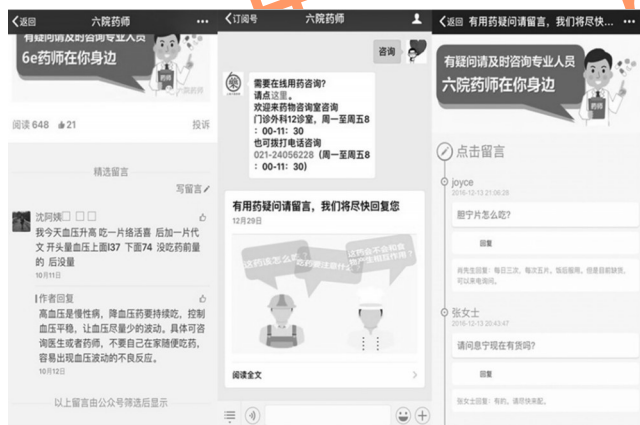
图3 “六院药师”微信平台嵌入式咨询示例

图2推送的内容直接来源于患者的咨询问题,由药师查阅文献后形成科普文章进行推送。推送的内容既直接回答了患者实际用药过程中发生的问题,又增强了药师接受继续教育的意识 [6] 。“六院药师”微信平台嵌入式咨询示例见图3。