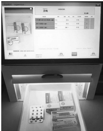
图2 药品实物信息图像化