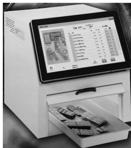
图1 处方药品核对机

出院带药的发放通常由药房统一调配,以往的药房工作模式主要以人工配药及核对信息为主,受工作量及环境因素影响,易产生调配数量错误、相似药品混淆、病区分配混乱等问题。因此,我院药剂科在国内首批引入处方药品核对机(如图1所示),利用图像识别技术,将药品实物信息图像化(如图2所示),使药品核对工作直观简洁,有助于提高出院带药配药工作效率,减少调配误差。